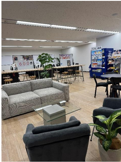
来客時や社内 MTG に使用できるスペース