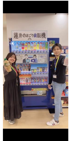
“社長のおごり”で飲み物がもらえる、 「社長のおごり自販機」=「蓮井のおごり自販機」を設置！ 従業員同士のコミュニケーションにも役立っています。