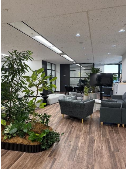
観葉植物もあり、こだわりのある開放的なデザイン