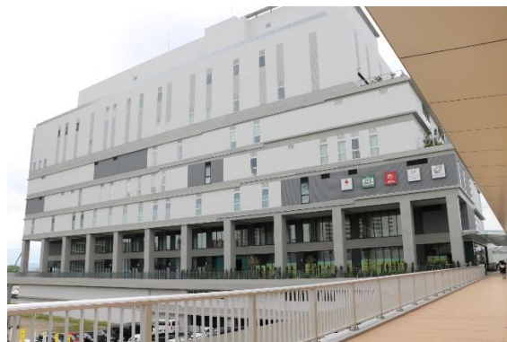
(左) 園長大学® 保育士大学スクーリングの様子。(右) 小田急線「海老名」駅「VINA GARDENS PERCH」内に保育園を展開、街づくりに貢献しています。