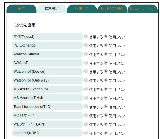
OpenBlocks® IoT Family WEB UI

http://openblocks.plathome.co.jp/sensor-dev/