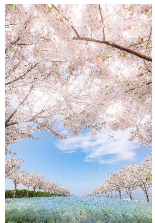
ネモフィラ祭り 2024 Instagram フォトコンテスト グランプリ作品

グランプリ 1 名・副賞 5 万円商品券／ネモにゃん賞 3 名・副賞 1 万円商品券／ 素敵で賞 5 名・副賞 5,000 円商品券 応募期間：2026 年 5 月 11 日(月)までの投稿分まで