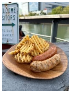
POTALU (ワッフルポテト等)