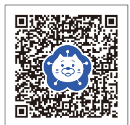
公式ホームページ