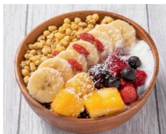
美佳味 (アサイーボウル)