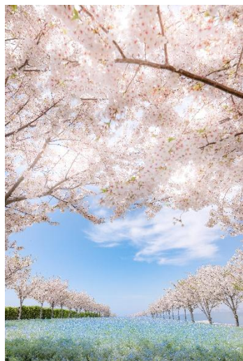
桜コラボゾーン(イメージ)

春に見頃を迎える桜やチューリップとネモフィラのコラボゾーンを設置しています。青一面のネモフィラ畑とはまた違った風景をお楽しみいただけます。