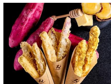
天 carat (やきいも天ぷら)