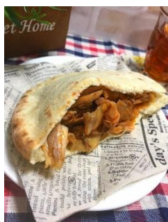
THE BEST KEBAB (ケバブ)