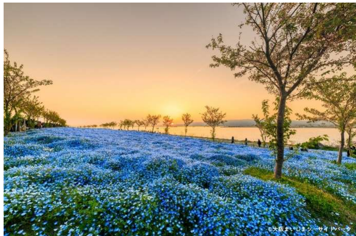
夕陽とのコラボ(イメージ)