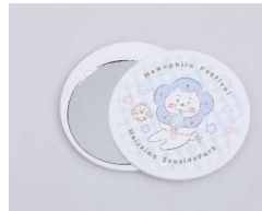
ネモにゃんグッズ