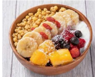
美佳味 (アサイーボウル)