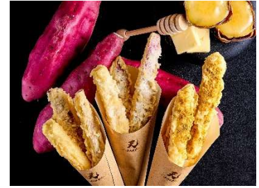
天carat (やきいも天ぷら)