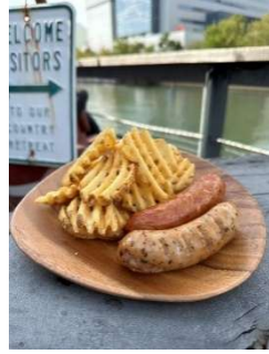
POTALU (ワッフルポテト等)