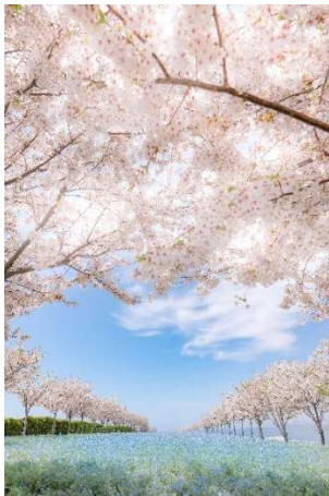
桜とのコラボ(イメージ)

春に見頃を迎える桜やチューリップとネモフィラのコラボゾーンを設置しています。青一面のネモフィラ畑とはまた違った風景をお楽しみいただけます。また、開催期間中の土日祝日は、ロング営業(9:00~18:30 ※最終入園18:00)を実施します。水平線に沈みゆく夕陽と、オレンジ色に照らされ紫に輝くネモフィラの絶景コラボを、ぜひお楽しみください。