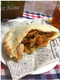
THE BEST KEBAB (ケバブ)