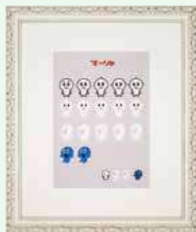
おばけのマールキャラクターデザイン案(個人蔵)