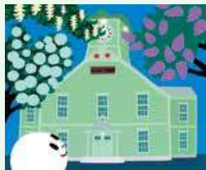
絵本『おばけのマールとおかしなとけいたい』(2012年)原画