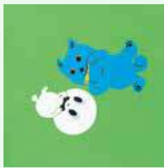
絵本『おばけのマールとすてきなことば』(2020年)原画