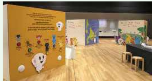
アイヌ語を学べる体験型展示