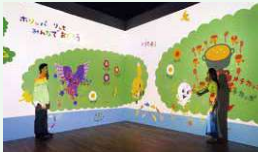
クリエイティブカンパニー NAKED, INC.(ネイキッド)が手がける体験型デジタルアート ©naked inc.