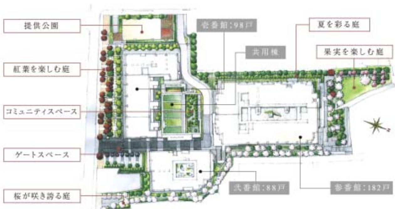
計画地全体敷地配置図