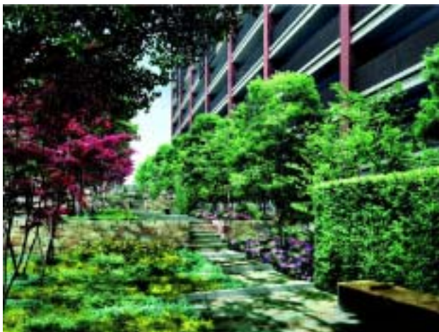
「紅葉を楽しむ庭」完成予想 CG

また、道沿いのテラスや参番館のエントランスから花見を楽しむことができる「桜が咲き誇る庭」は、サクラの並木が春の訪れをあでやかに彩ります。