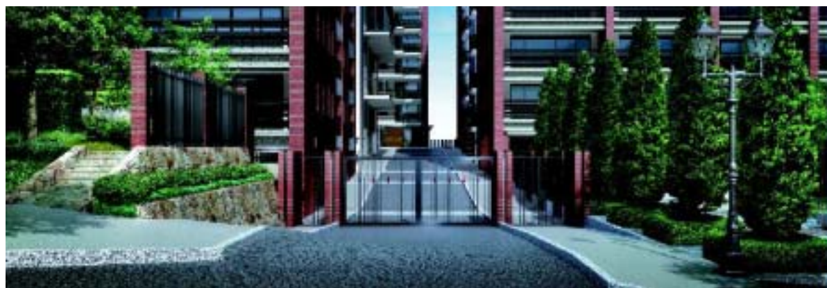
ゲートスペース完成予想 CG

シンボリックに佇むガス灯、石積みのゲートウォール、そしてアイアンワークによる門扉等、横浜を象徴するモチーフを取り入れたゲートスペースが住む方をお迎えします。また、針葉樹の列植などが端正な空間を演出します。