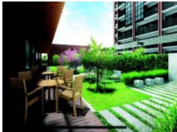
「ルーフテラス」完成予想 CG