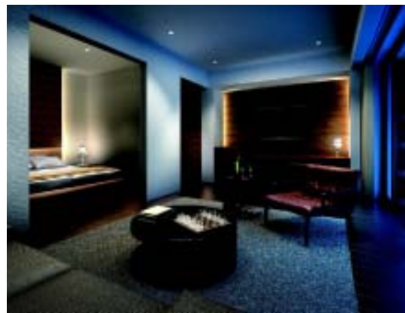
「ゲストルーム (洋室タイプ)」完成予想 CG