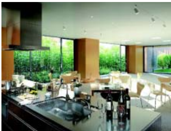
「キッチンスタジオ」完成予想 CG