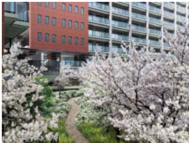
「桜が咲き誇る庭」完成予想 CG