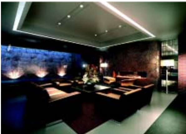
「ラウンジ」完成予想 CG

横浜の伝統を想わせる素材を積極的に取り入れ、重厚な雰囲気演出するラウンジやライブラリーをはじめ、2つのゲストルームや、コミュニティを育むキッチンスタジオ、コミュニティルーム、ルーフテラスなど、多くの共用施設を備えています。