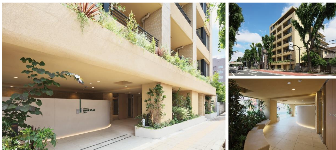
▲(左)エントランス (右上)外観 (右下)エントランスアプローチ

甲州街道沿いながら心地よさを感じる建物計画と、調布という街の緑との調和を目指した植栽計画に、専有部の延長として使用できるセカンドリビングを確保。都市型コンパクトマンションが一定数普及してきた中、単身者・ディンクスが次に求める住まいを想像し、郊外型コンパクトマンションのあり方を提案しました。