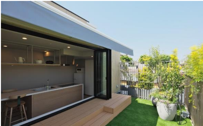
▲木々に囲まれたテラス

コンパクトマンションの課題である専有部の狭さを解決するために、大きなキッチンとテラスを設えたWi-Fi 完備の「セカンドリビング」を設置しました。住む人が自宅のように家族や友人を招いて、専有部の延長として日常使いができる空間となっています。専有部よりも大きなキッチンや住民間でシェアして利用可能な調理グッズなど、気軽に快適に利用できる仕組みを多数取り入れております。