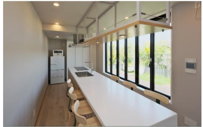
▲セカンドリビング