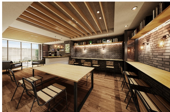
▲ラウンジ完成予想 CG

エントランスから中に入ると、レンガや木などの質感にあふれたラスティックな空間。ナチュラルな雰囲気を感じられるラウンジです。ただ通り過ぎるだけではなく、いつまでもいたくなるような、心地いいコモンスペースがあります。