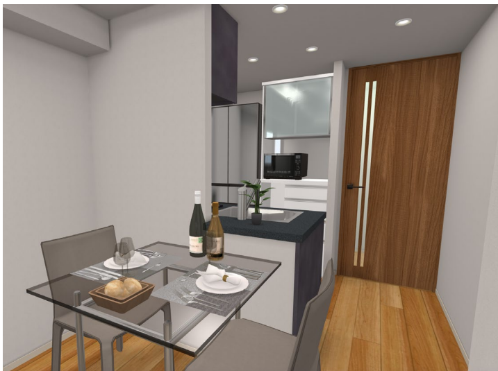
▲Aタイプ 室内イメージCG

また、リビング・ダイニング扉や玄関床、フローリング、クロス、キッチンなど、内装のカラーセレクトをニコアンドが協力しています。カラーは無償で選択することができ、寛ぎの中に個性を感じる空間を表現できます。