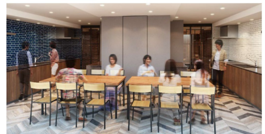
▲『リビオセゾン亀有』共用キッチン完成予想CG

日鉄興和不動産とニコアンドは、2019年1月、分譲マンション初のタイアップとなった『リビオ錦糸町』のデザイン協力をきっかけに、2020年にはラボとコラボレーションしニコアンドの家具シリーズ「niko and ...FURNITURE&SUPPLY」のノウハウを活かしたオリジナルベッドフレーム・インテリアオプションを開発。さらに、学生向け賃貸レジデンス『リビオセゾン亀有』のインテリアや空間演出をニコアンドがプロデュースするなど、様々な取り組みを行ってきました。