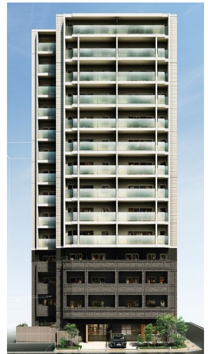
▲『リビオレゾン王子』外観完成予想CG

本物件は、日鉄興和不動産が運営するリビオライフデザイン総研で活動している、シングルライフのための暮らし・住まいの研究所「+ONE LIFE LAB」（プラスワンライフラボ：以下ラボ）が実施したグループインタビューで得た単身世帯の方の声を元に、これからのシングルライフの住まいの在り方をニコアンドと共にカタチにした物件となります。