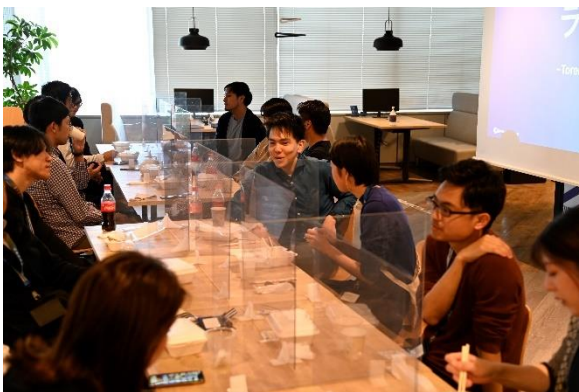
コミュニティ作りのためのランチ会

3か月に一度の事業進捗情報共有「Quarterly SPROUND」やラフな情報交換の場としてのランチ会等のイベント実施だけでなく、毎週のメールマガジン配信・Slackの運用等の「With コロナ時代」を見据えたオンライン施策も展開してきました。『SPROUND』の利用企業が自社のみならず、共に戦う仲間として互いに状況を知ることで、切磋琢磨しながら企業としての成長を目指す環境を整えています。