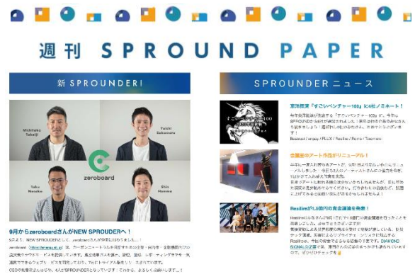
毎週配信のメールマガジン「週刊 SPROUND PAPER」