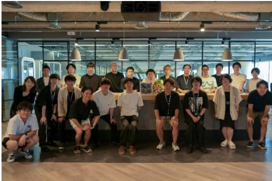
卒業したスタートアップ企業の皆さん

『SPROUND』では、事業成長・人員拡大を実現したうえで『SPROUND』からの卒業を目指していただいている中で、5社のスタートアップが人員拡大等の理由により卒業しました。また、『週刊東洋経済』が発表する「すごいベンチャー100」において、2020年度版から2022年度版までの3年間で11社のSPROUND利用企業が掲載されました。『SPROUND』が成長性の高いスタートアップが集まる場として評価をいただいています。