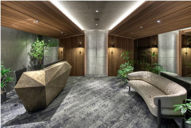
「グランリビオラウンジ」エントランス

『グランリビオ表参道』、『グランリビオ市谷砂土原』の2物件は、品川駅・港南口に所在する「品川インターシティ」にオープンする「グランリビオラウンジ」にて販売いたします。本ラウンジでは『グランリビオ表参道』、『グランリビオ市谷砂土原』のモデルルーム、カラーや設備仕様をご案内いたします。