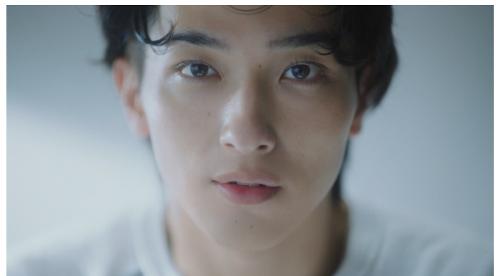
新CM「人生が動き出す_朝」篇（30秒）より