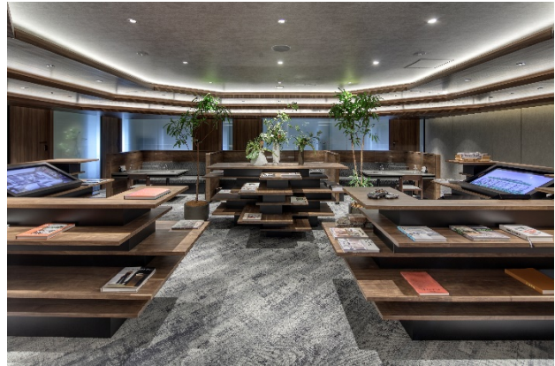
「グランリビオラウンジ」ラウンジ