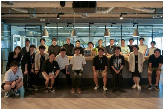
卒業したスタートアップ企業の皆さん

『SPROUND』では、事業成長・人員拡大を実現した上で『SPROUND』からの卒業を目指していただいている中で、人員拡大等の理由により卒業したスタートアップは10社を超えました。また、SPROUND 利用企業・出身企業の各種メディアへの露出も目立つようになり、『SPROUND』が成長性の高い社会的注目を浴びているスタートアップが集まる場として評価をいただいています。