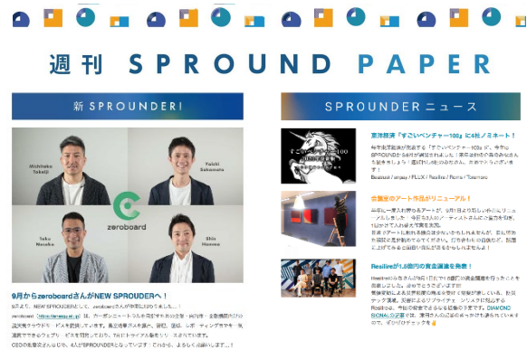
毎週配信のメールマガジン「週刊 SPROUND PAPER」