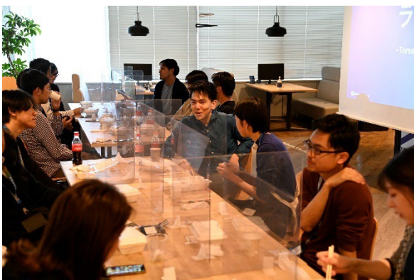
コミュニティづくりのためのランチ会

3カ月に一度の事業進捗情報共有「Quarterly SPROUND」やラフな情報交換の場としてのランチ会等の交流イベント実施だけではなく、毎週のメールマガジン配信・Slack の運用等のオンライン施策も展開してきました。『SPROUND』の利用企業が自社のみならず、共に戦う仲間として互いに状況を知ることにより、切磋琢磨しながら企業としての成長を目指す環境を整えています。