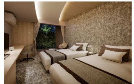
▲ゲストルーム完成予想 CG