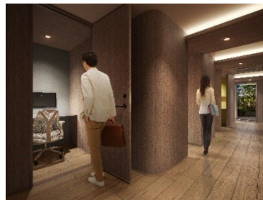
▲パーソナルブース完成予想 CG