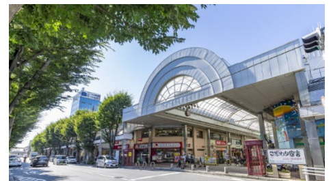
▲JUJU きたなら習志野台商店街

徒歩 5 分圏内に、約 29 店舗が集まる「JUJU きたなら習志野台商店街」や、「西友 北習志野店」、野球場として利用できる多目的の広場やテニスコートを備えた「北習志野近隣公園」が位置し、日々の生活も便利です。駅徒歩 2 分が叶える快適なアクセスと、住居系地域ならではの穏やかな住環境は、地元から中広域の方まで幅広い方々にご評価いただいております。