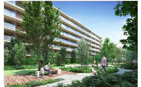
▲コミュニティガーデン完成予想 CG

敷地面積約 16,000 m 2 の広大な敷地を生かし、さまざまな共用部を計画しました。ダンスやフィットネスなどに利用できる「ウェルネススタジオ」、集中して作業したい時やリモートワーク時に便利な「パーソナルブース」、テーブルや座卓でボードゲームを楽しんだり、パーティー会場として利用することのできる「コミュニティルーム」、遠方からお越しになるゲストをもてなす「ゲストルーム」、「洗車スペース」や「みんなの洗い場」など、ゆとりあるランドプランを計画いたしました。災害時には地域の住民の方々にも開放可能でつながりを創出する「コミュニティガーデン」は、第1期ご来場の皆さまにも特にご評価いただき、街と調和する共同住宅を目指しております。