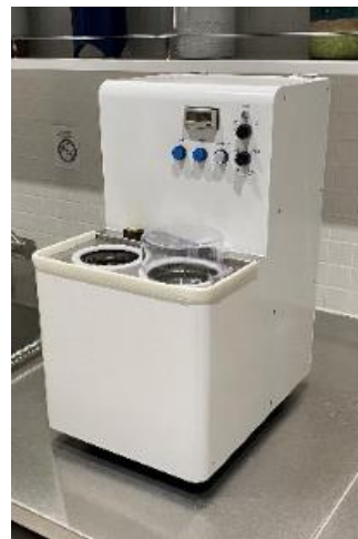
▲象印マイボトル洗浄機