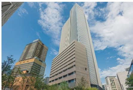
▲赤坂インターシティ AIR

プロジェクト名：「Building 2 Bottle」プロジェクト 場 所：赤坂インターシティ AIR 期 間：2024年8月26日～10月31日（予定） 住 所：東京都港区赤坂1丁目8-1