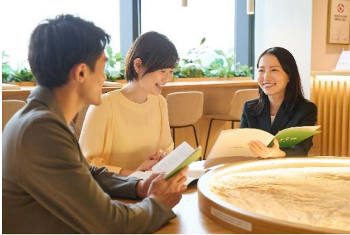
▲ライフデザイナーへのご相談

本サロンでは、契約者さま・入居者さまに暮らしを豊かにするきっかけを提供すべく、毎月さまざまなイベントを開催しており、今後もさらなる拡充を図ってまいります。また、本サロンに常駐するライフデザイナー（コンシェルジュ）が、首都圏エリアの物件に加えて関西エリアや九州エリアの物件もご紹介できるよう人員体制強化を図っております。