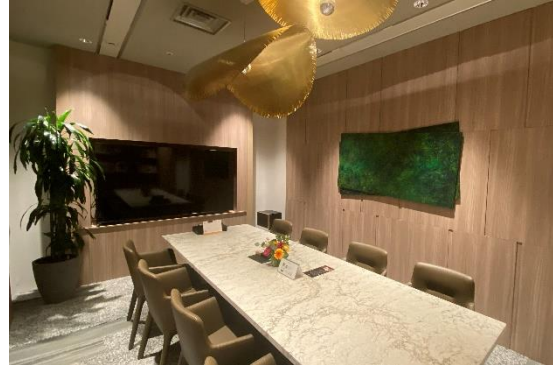
▲改修した接客スペース