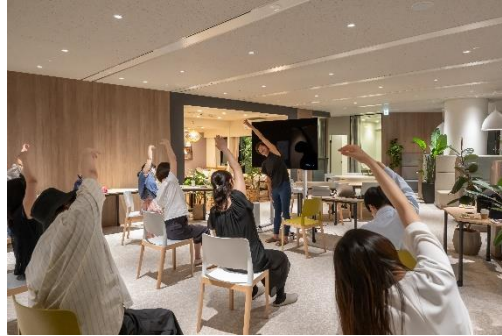
▲過去の入居者さま・契約者さま向けイベント