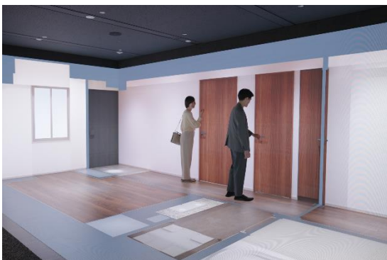
▲リアルサイズスクリーン

この度、さらなる体験価値の向上を目指し、業界で初めて「Apple Vision Pro」を用いて投影された実寸大の間取りに家具などの配置もリアルに体感することが可能な MR 体験アプリケーションを開発し、実証実験を開始いたします。これにより、本スクリーンに投影された間取りに対し、家具の配置を重ね合わせる没入感の高いリアルな MR 体験が可能になります。今後実証実験を重ね、2024 年 10 月以降のお客さまへの案内開始を予定しています。