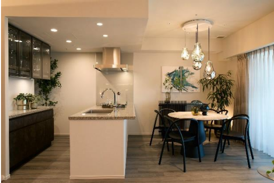
▲改修したサンプルルーム

人件費、資材費、用地費の上昇などを背景に販売価格が高騰している状況を受け、本サロンにおいても一部高額価格帯の物件販売を行うこととし、接客スペースやサンプルルームなどについて、高額価格帯に合わせた仕様に改修を行いました。