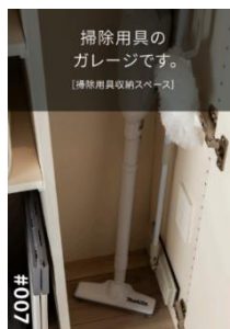
▲リビオアイデアズの一例