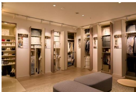
▲リビオアイデアズ収納展示

リビオは毎年、社員自らが赴く入居者訪問インタビューやアンケート調査で集められたお客さまの声を商品企画へ反映しています。生活していく中で“あったらいい”を各ポイントに落とし込み、住まう方目線のマンションづくりを実現します。“選ぶとき、買うとき、住み始めたとき、住んだあとの暮らし”など、マンションとの出会いから暮らしまで、マンションでの日々のさまざまなシーンを生活者視点で見つめ、商品企画を行っています。