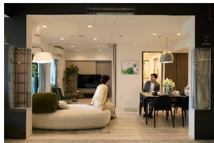
▲改修したサンプルルーム