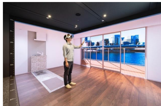
▲「Apple Vision Pro」を用いた体験シーン