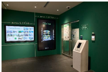
▲新設したリビオ紹介スペース