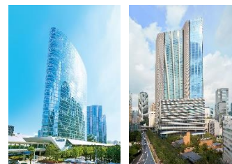
▲（左）品川インターシティ （右）赤坂インターシティ AIR