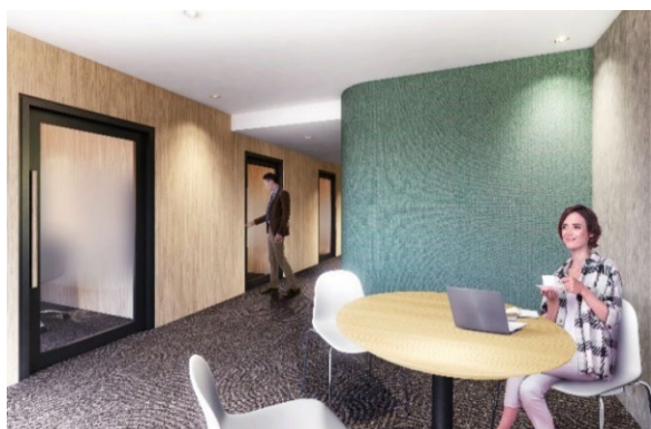
▲「ワーク&スタディールーム」完成予想CG