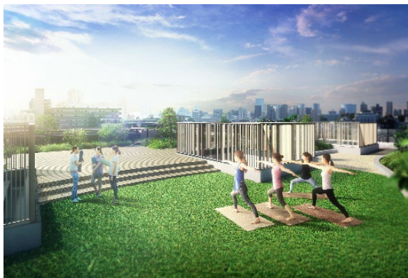
▲「屋上テラス」完成予想CG

900㎡超となる都心部では屈指の大きさを誇る『屋上テラス』をはじめとする8つの共用空間について、大規模ならではの充実した共用施設を評価いただいております。特に、ゴールドジムのスタッフがマシンの選定から設置まで全面協力した『フィットネスラウンジ』、個室ブースを設定し、2人で利用できることにより家族や家庭教師でも利用できる『ワーク&スタディールーム』、定期的な書籍の入れ替えがあり、中庭の枝垂桜を眺めながらコーヒーも楽しめる『ライブラリーラウンジ』が高評価をいただいております。