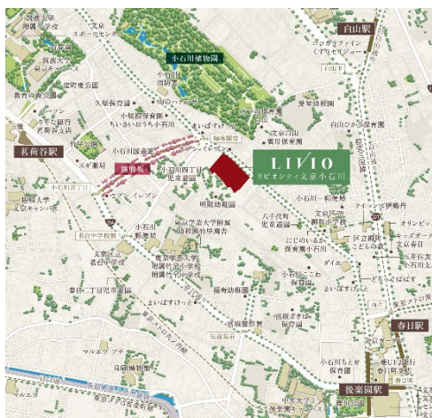
▲『リビオシティ文京小石川』物件位置図