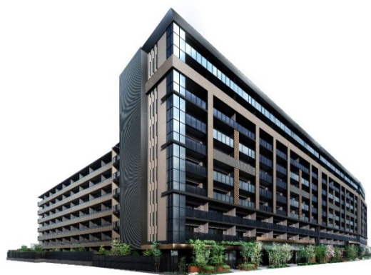
▲東側外観完成予想 CG

※3：東京メトロ丸ノ内線・南北線「後樂園」駅徒歩 12 分（サブエントランスより）／東京メトロ丸ノ内線「茗荷谷」駅徒歩 13 分／都営地下鉄三田線・大江戸線「春日」駅徒歩 11 分（サブエントランスより）／都営地下鉄三田線「白山」駅徒歩 10 分