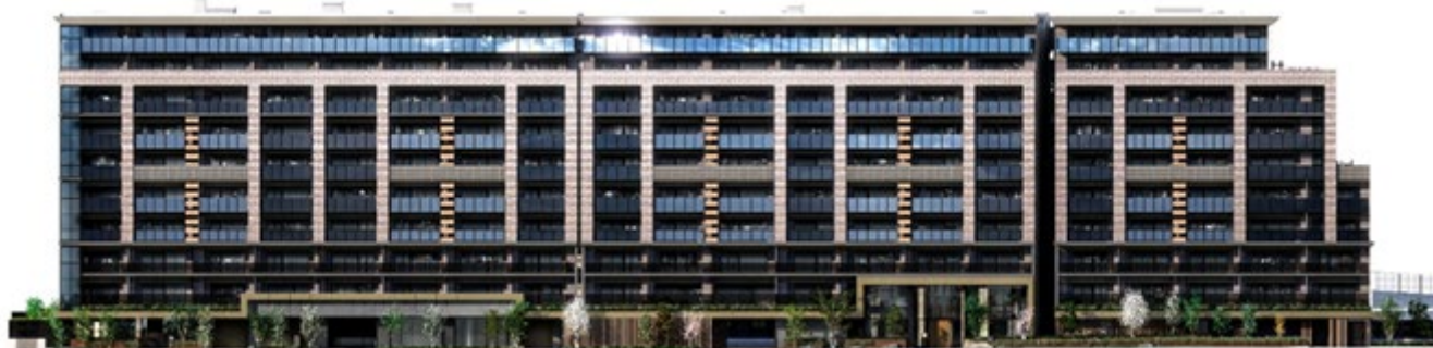
▲『リビオシティ文京小石川』外観完成予想 CG