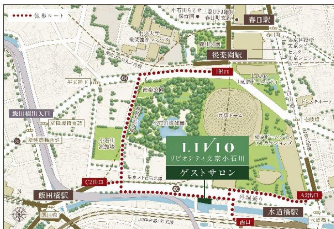
▲『リビオシティ文京小石川』ゲストサロン位置図