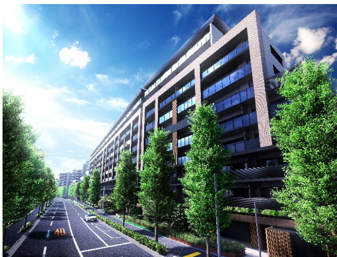
▲北側外観予想 CG（1F 一部店舗）