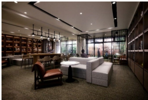
▲「ライブラリーラウンジ」完成予想CG