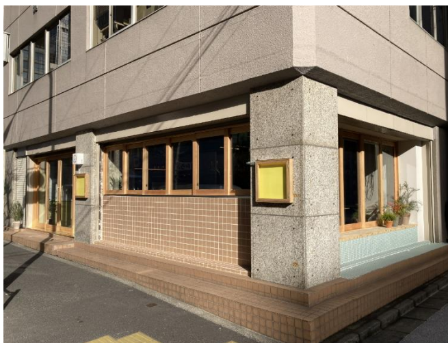
「Sustainable Food Museum」外観

“資源の保全”や“食の多様性”など6つの社会課題をテーマに、約100社の技術や商品を集め、紹介します。この場所は、訪れる人が新しいモノ・コト・ヒトとの出会いを通じて、次の一歩へのヒントや新たなアイデアを得て、共創を育む場として機能することを目指します。