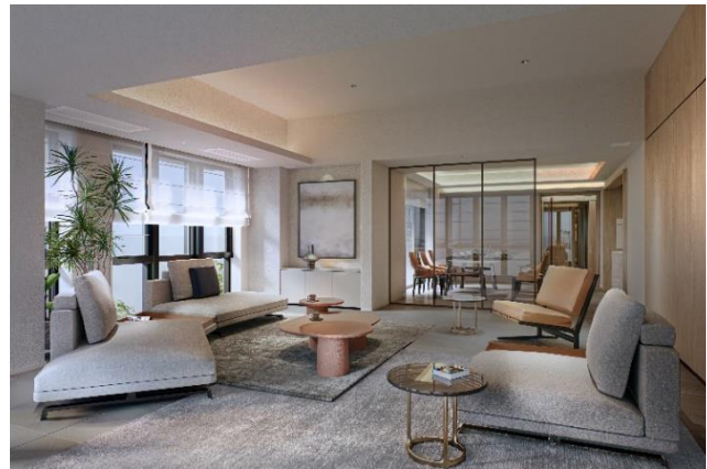
▲「Iタイプ リビング」完成予想 CG