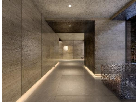
▲「エントランスホール」完成予想 CG