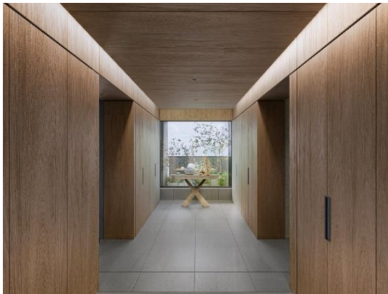
▲「Iタイプ ホワイエ」完成予想 CG