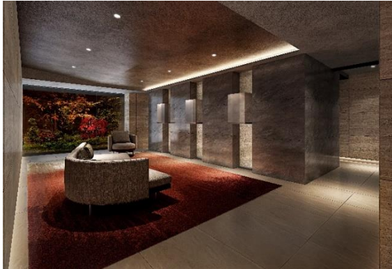
▲「ギャラリーラウンジ」完成予想 CG