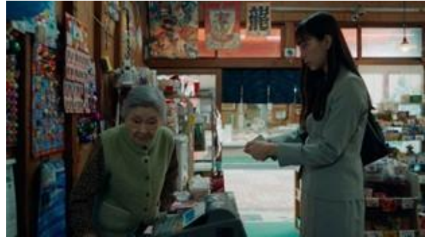
▲ブランデッドムービー『I THINK』より