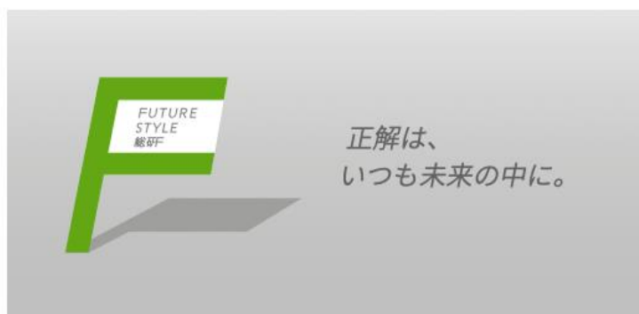
▲『Future Style 総研』ロゴ

日鉄興和不動産株式会社（本社：東京都港区、代表取締役社長：三輪 正浩、以下「日鉄興和不動産」）は、総合研究所『Future Style 総研』を、2025年4月1日に設立したことをお知らせいたします。