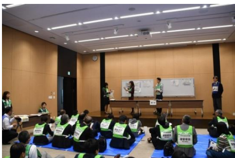
外部帰宅困難者への情報提供