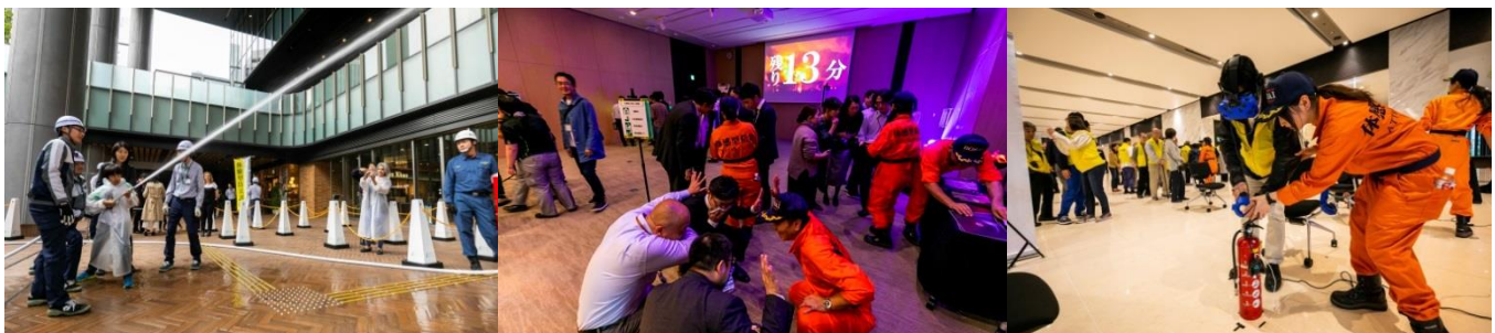
屋内消火栓放水訓練