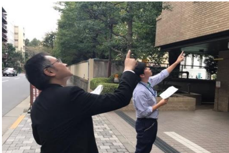
建物被害調査訓練（外観）