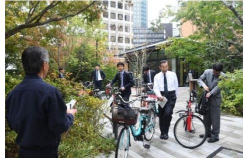
各ビル駆け付け訓練