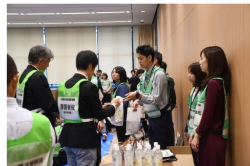
外部帰宅困難者への物資提供