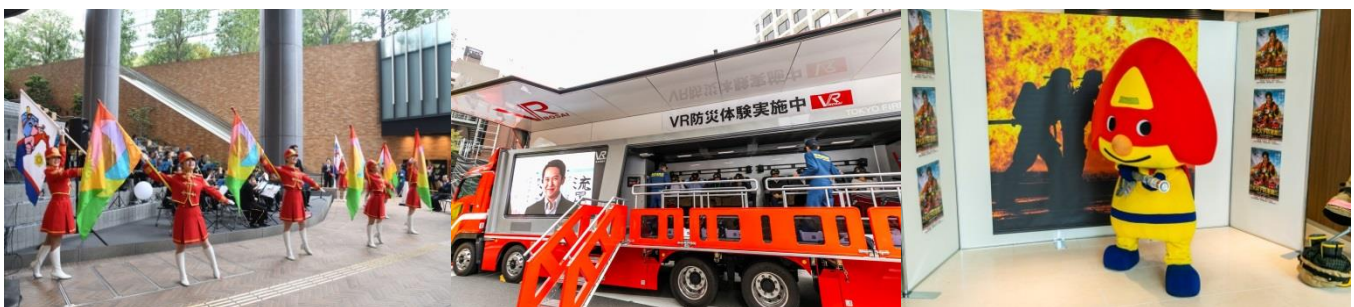
東京消防庁音楽隊・カラーガーズ演奏

今回実施した各種体験型訓練は、東京消防庁VR防災体験車による最新鋭のバーチャルリアリティ技術を使用した防災体験やバーチャル消火器操作体験を実施した他、エレベーター閉じ込め体験やAED使用方法を学ぶ応急救護訓練、災害用備蓄食料の試食、赤坂消防署、港区の展示等を行いました。また地元町会である赤坂東一・二丁目町会・赤坂溜池町会との合同訓練、近隣外国人居住者を対象とした外国人向け訓練ツアーも同時に実施し、延べ3,100人を超える方々に参加いただきました。当該訓練を通して地域一人ひとりの防災意識を高め、対応能力を向上させることで、災害に強い街づくりに繋がることを期待しています。