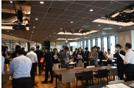
災害対策本部立ち上げ訓練