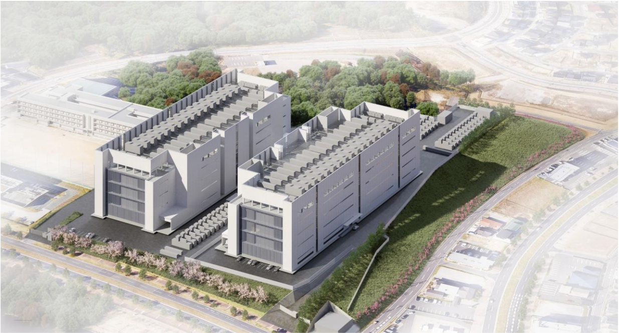
▲VOLTA プロジェクト 外観パース