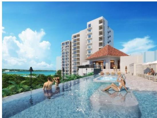
屋外インフィニティプール（イメージ）