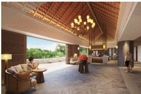
エントランスホール