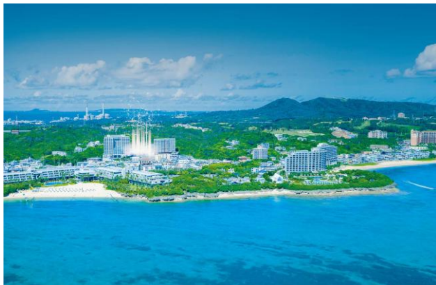
周辺俯瞰図（イメージ）

<公式ホームページ URL> https://www.blisstia-onnason.jp/ ※2 月 6 日（金）12:00 公開予定