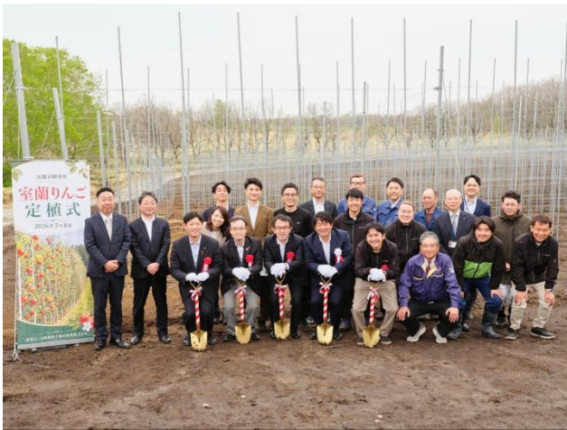
▲定植式にご参加された皆さま