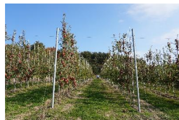
▲高密植栽培の様子

※1：高密植栽培とは、世界的に主流となってきた収益性、効率化を求める栽培方法。日本で広く採用されている方法で栽培するりんごの1反当りの平均収量は約2トンですが、高密植栽培では3倍に当たる1反当り約6トンの収穫が可能とされています。1本1本の樹を細く仕立てることで面積当たりの定植本数を増やし、また、樹を一直線に並べて植えることができるので、農作業の効率化に適しています。(日本農業 HP より)