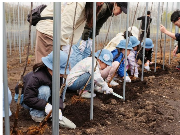
▲近隣の幼稚園児による定植体験イベントの様子

今期は、約5haの農地の内、26年度開園分0.75haにて「ふじ：1,029本」「ぐんま名月：2,142本」「シナノスイート：28本」の合計3品種：3,199本を植える予定です。高密度植栽培は早期多収が特徴であり、翌々年の2028年には少量の収穫・出荷が可能となる見込みです。また、樹が成長し、収穫量が安定して最大化するのは定植から約6年目（2031年頃）を想定しています。