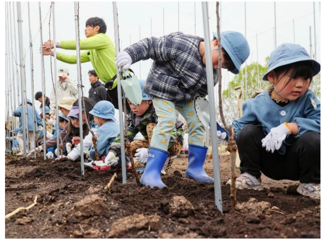
▲近隣の幼稚園児による定植体験イベントの様子