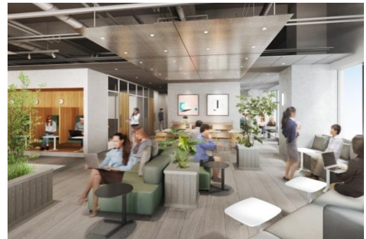
▲ソファラウンジ完成予想 CG