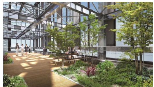
▲スカイテラス完成予想 CG