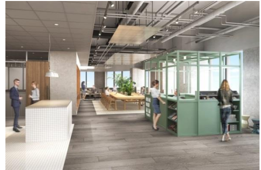
▲エントランス完成予想 CG