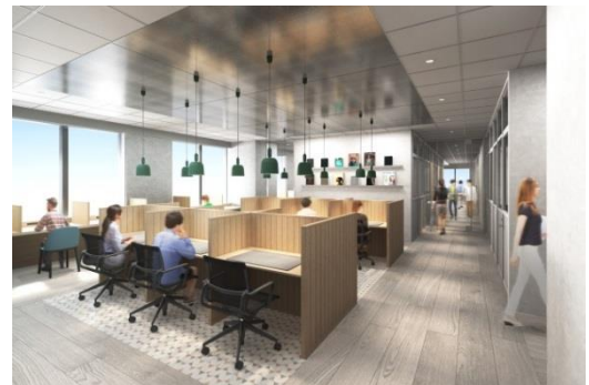
▲デスクブース完成予想 CG