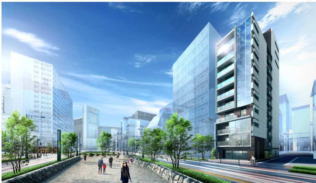
▲（右）『リビオレゾン新虎通り』外観完成予想CG

*新虎通り沿いにおける新築分譲マンションの供給は2010年11月に発売された「新橋プラザビルコアレジデンス」（2011年3月竣工）以来、9年3カ月ぶり。（当社調べ）