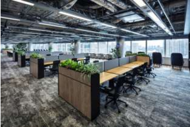
▲写真⑦ Focus ゾーン