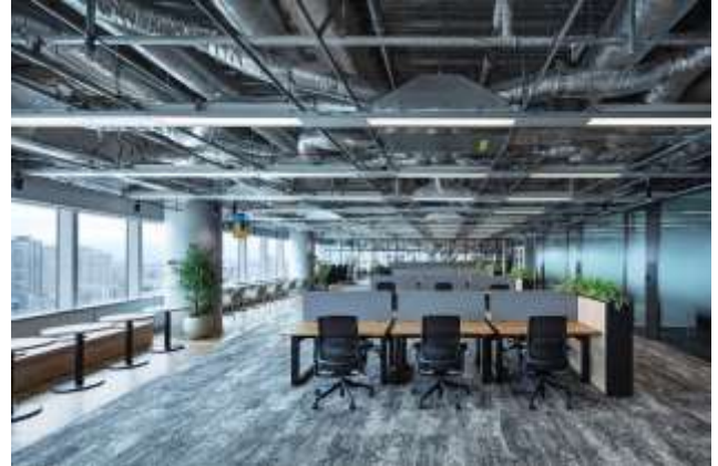
▲写真⑧ Focus ゾーン