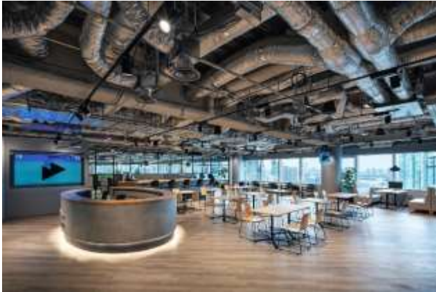
▲写真① Communication ゾーン