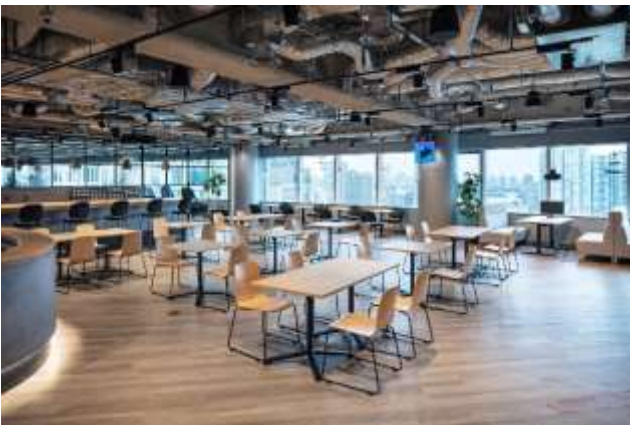
▲写真③ Communication ゾーン