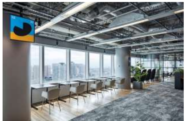
▲写真⑥ Focus ゾーン