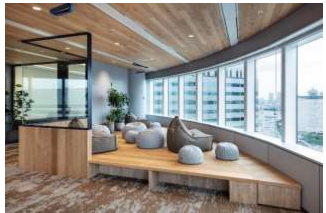
▲写真⑩ Relaxation ゾーン