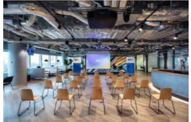
▲写真② Communication ゾーン