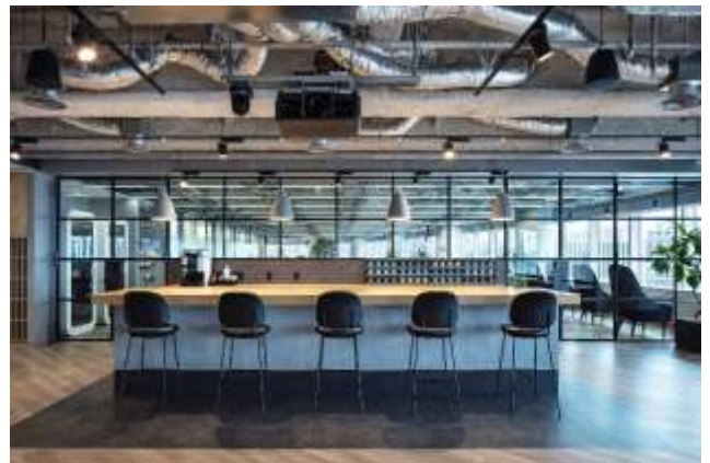
▲写真④ Communication ゾーン