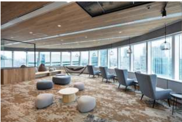
▲写真⑨ Relaxation ゾーン