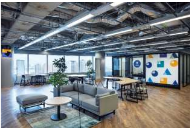
▲写真⑤ Collaboration ゾーン