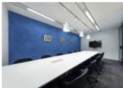
▲セカンダリーカラーに対応した会議室