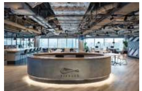
▲モビールを施したエントランス