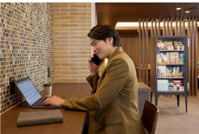
ワーキングスペース