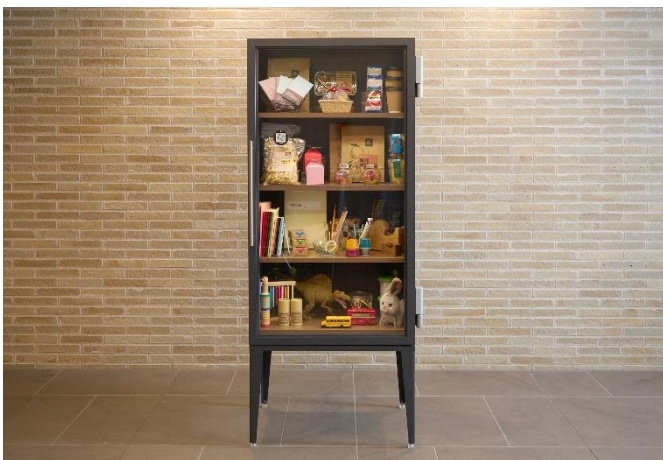
マンション専用 無人ストア “Store600”

一方で、新型コロナウイルスの影響などにより、マンション居住者のライフスタイルやニーズが多様化している社会的背景、また従来の「無人コンビニ600」はマンションに設置する上での意匠性・商品ラインナップなどの課題がありました。そこで、マンションに設置する無人ストアとして最適化されたサービスを提供すべく、マンション専用の無人ストア “Store600”を、600と共同開発することに至りました。今回のアップデートに当たっては、2社の社員によるワークショップや既存顧客への調査を行いながら、リニューアルを行いました。