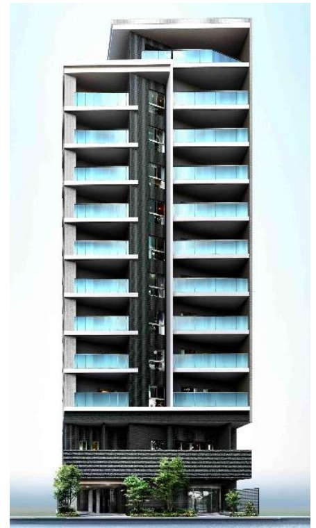
▲『リビオレゾン入船』完成予想図