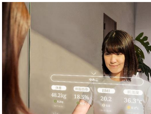
▲cheercle ® ミラー（イメージ）