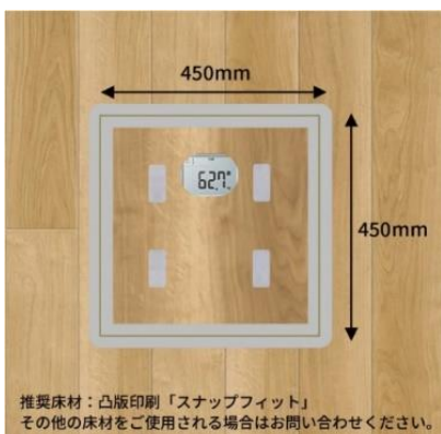
▲cheercle ® メーター（イメージ）