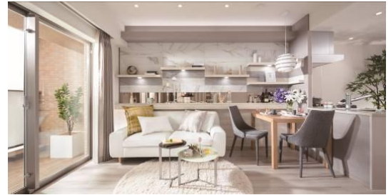
*ARを活用したルームガイド「7人のコビトをさがせ！」