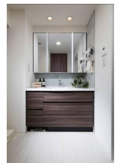
オリジナル洗面化粧台

※「+ONE LIFE LAB」公式サイト : http://plusonelife-lab.jp/