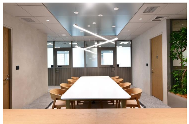
▲目的に合わせて選べるフリーアドレスオフィス