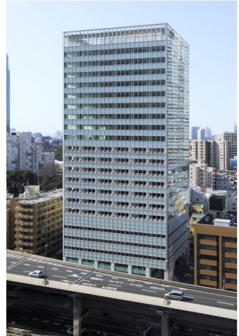
▲「アーキヒルズフロントタワー」外観