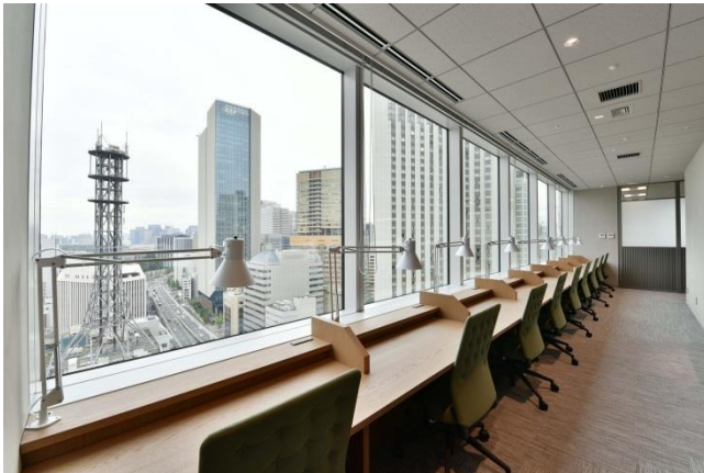
▲眺望に恵まれたパーソナルスペース