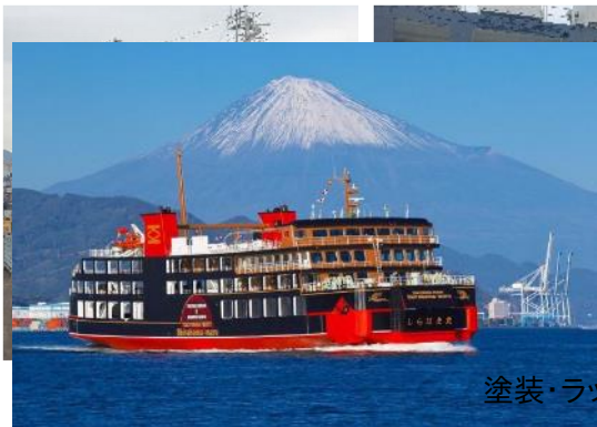
塗装・ラッピング中の黒船(しらは丸)