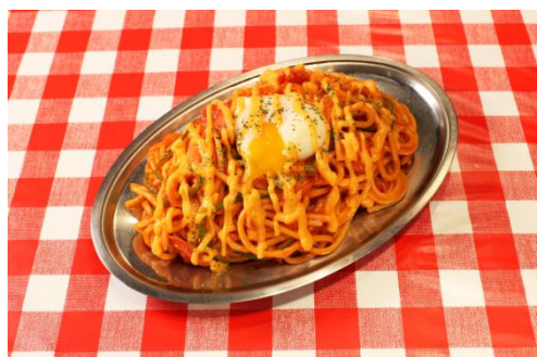
“ナポリたん”をイメージした 「とろ〜り温玉チーズナポリタン」

今回は、『ニコニコ超会議 2018』の開催にあわせて、ナポリたんやミートソースなどのメニューで人気を集める外食店「スパゲッティのパンチョ」において、コラボメニューの提供をおこないます。“ナポリたん”をイメージしたメニューとして、濃厚チェダーチーズに温玉をのせた「とろ〜り温玉チーズナポリタン」を、“ミート総帥”をイメージしたメニューとして、お客様リクエスト No.1 の、ミートボールの入ったミートソースパスタ「ミート in ミートソース」を、それぞれ展開予定です。