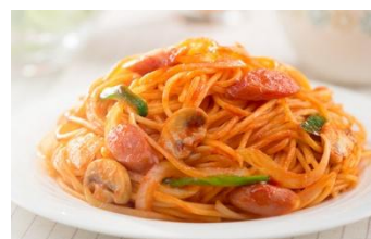
追いケチャナポリタン

ブース内では、昨年に引き続き、カゴメが監修したオリジナルレシピで作ったフード販売を実施。前回、30分待ちの行列ができるほどの人気を博し、予定数がすぐに完売した「追いケチャナポリタン」(「カゴメトマトケチャップ」使用)のほか、今年は新たに「フライパンで10分!ミートソース」(「カゴメ基本のトマトソース」使用)をご用意。それぞれ、各日限定750食ずつ販売します。