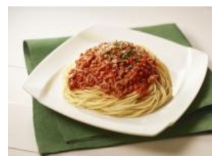
フライパンで10分! ミートソース