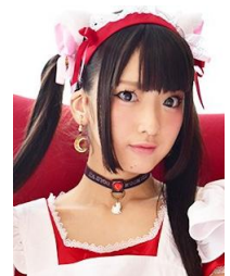
“ミート総帥”担当 火将ロシエルさん