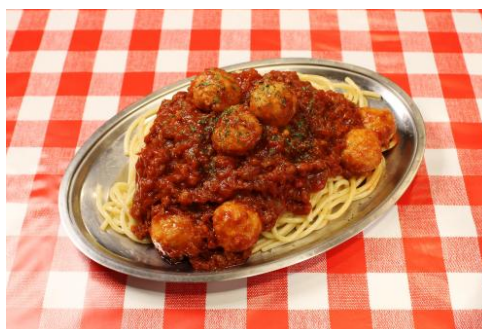
“ミート総帥”をイメージした 「ミート in ミートソース」

また、期間中にコラボメニューをご購入いただいた方には、“ナポリたん”“ミート総帥”それぞれのグッズをプレゼントするキャンペーンも実施。『ニコニコ超会議 2018』開催前～開催中である2018年4月21日(土)～4月29日(日・祝)の期間には、注文したメニューにあわせて、各キャラクターのオリジナルステッカーをプレゼント。『ニコニコ超会議 2018』開催後、2018年4月30日(月・休)～5月6日(日)には、各キャラクターがプリントされたA5サイズクリアファイルをお渡しいたします。(各店舗数量限定)