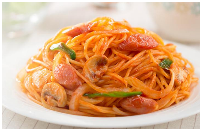
カゴメトマトケチャップ(500g)