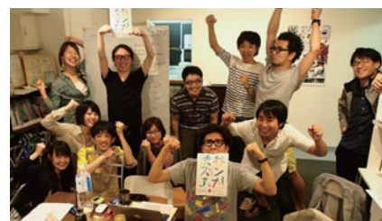
月1〜2回実施してきた「チーム・ズンチャカ!」ミーティング

昨年、2014年7月に開催したイベントでは、みやした こうえんと神宮通公園のみで開催し、約5000人の参加者が訪れました。その後、一般公募から集まったボランティアを中心に「チーム・ズンチャカ!」を結成。企画に関する議論を一年間重ねてきました。今年の「渋谷ズンチャカ!」は、市民が初めてつくる市民のための記念すべき第1回目の音楽フェスティバルとなります。