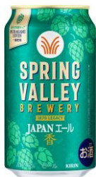
「JAPAN エール 香」