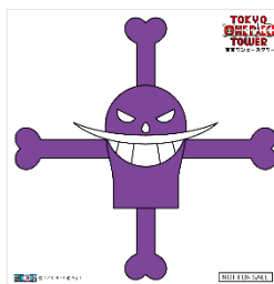
マルコ&ローバースデイ限定 ドデカクリアステッカー ※バースデイ当日限定