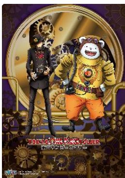
表 「HWクリアファイル2018」（400円+税）