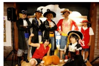
※写真は過去のイベントのものです

詳しくは公式サイトをご確認ください【 https://onepiecetower.tokyo/ticket/ 】