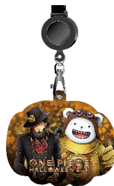
「HWチケットホルダー2018」（各種900円+税）