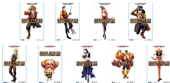
ハロウィンなりきりステッカー ※ランダム配布

さらに、10月5日（金）のマルコの誕生日に「白ひげ海賊団」の“なりきり”で「白ひげ海賊団」ドデカクリアステッカーを、10月6日（土）のローの誕生日に「ハートの海賊団」の“なりきり”で「ハートの海賊団」ドデカクリアステッカーをプラスでプレゼント！バースデイ当日限定のステッカーなのでお見逃しなく。