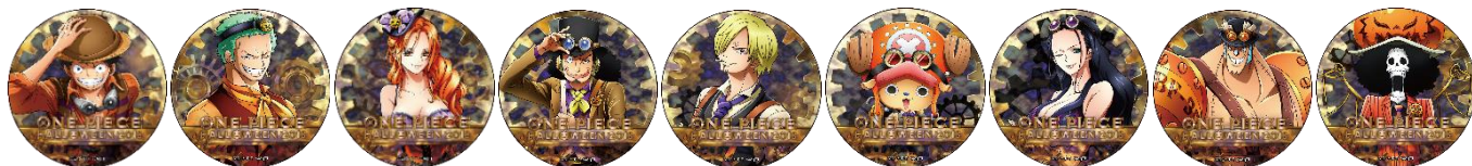
「HW缶バッジ2018（全11種）」（463円+税）