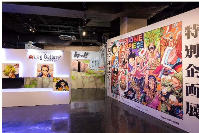
※写真はSeason4 `敵(ライバル)`の様子

『ONE PIECE』史上初の常設屋内テーマパーク「東京ワンピースタワー」の5階てっぺんフロアにて大好評開催中の特別企画展「ログ ギャラリー」が11月1日(木)より新シーズンに突入。そしてSeason5で「ログ ギャラリー」がファイナルを迎えます。