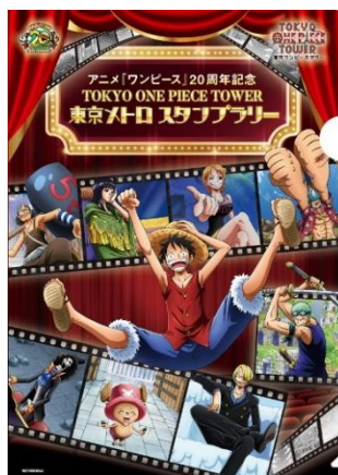
全10駅達成賞 オリジナルクリアファイル