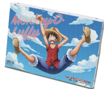
Wチャンス賞 オリジナルキャンバスボード くルフィ賞