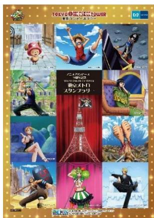
5駅達成賞 オリジナルステッカー

☆さらに！5駅以上のスタンプを集めると「東京ワンピースタワー」の「PARK PASS」が200円割引に！