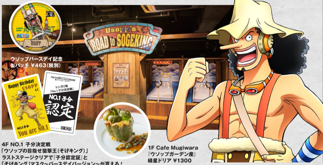
4F NO.1 子分決定戦「ウソップの目指せ狙撃王(そげキング)」ラストステージクリアで「子分認定証」と「そげキング」マスク〜バースデーバージョン〜が貰える!

をゲットできるぞ!! 狙撃でヒートアップしたらCafe Mugiwaraで一休み。見た目もショーゲキ的な「ウソップガーデン産」緑星ドリアはいかが。最後に麦わらストアで『ウソップバースデー記念缶バッジ』をゲットしたらウソップのお祝いはパーフェクト! おっと、『トンガリ島スタンプラリー』で期間限定の『ウソップスタンプ』を押すのも忘れずに。