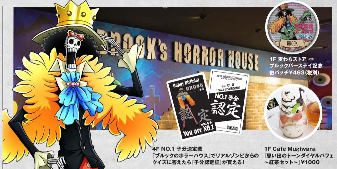
4F NO.1 子分決定戦「ブルックのホラーハウス」でリアルゾンビからのクイズに答えたら「子分認定証」が貰える!