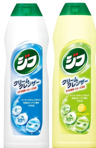
ジフ/ジフレモン ※写真左から