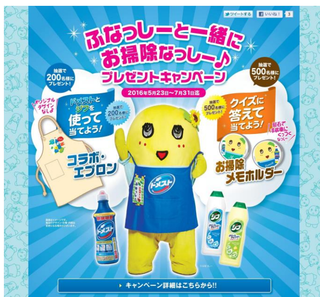
「ふなっしーと一緒に掃除なっしー♪プレゼントキャンペーン」TOP ページイメージ

ユニリーバ・ジャパンは、国民的ゆるキャラのふなっしーを「お掃除当番」として任命し、“かけて 3 分後に流すだけ”で簡単に除菌ができる、除菌クリーナー「ドメスト」と、“キズをつけずに”汚れをしっかりと落とす、クリームクレンザー「ジフ」を活用したお掃除術を店頭や WEB サイト上で紹介しています。