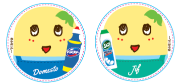
お掃除メモホルダー イメージ画像 ※2個セットとなります。

対象商品：「ドメスト」「ジフ」「ジフレモン」 「ドメスト」「ジフ」「ジフレモン」数量限定 ふなっしーボトル