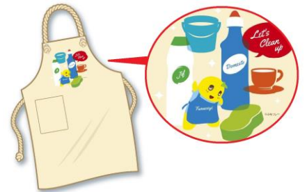
オリジナルエプロン イメージ画像

①②とも応募者全員に『ふなっしーお掃除メモ』（ダウンロード用 PDF 形式）を差し上げます。