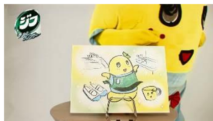
※「ジフ」のロゴとボトルは旧デザインのものです。

「ふなっしーのお掃除紙芝居」動画は、「ドメスト」と「ジフ」を使ったお掃除術を、かわいいオリジナルの紙芝居と「ヒャッハー！」「ブシャー！」とハイテンションなふなっしーのナレーションで紹介します。動画はキャンペーンページのほか、動画共有サイト「YouTube」でも公開いたします。