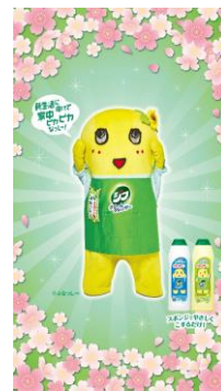
オリジナル壁紙（スマートフォン用）