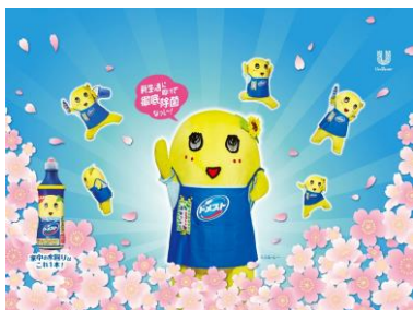
オリジナル壁紙（PC用）

【キャンペーンページ URL】 http://www.domesto.jp/special/funassyi/