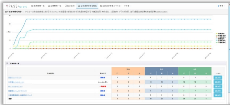
実施施設別に進捗を確認できる全体進捗情報詳細画面