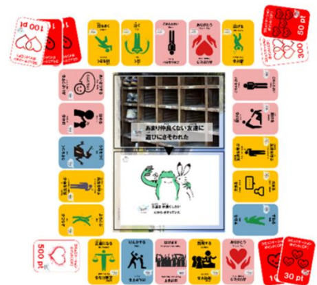
▲テーブルゲーム例