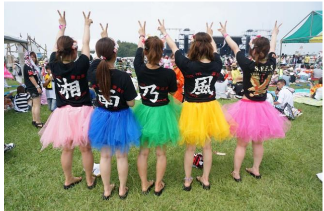
会場をより明るく彩るおそろいのコーディネート