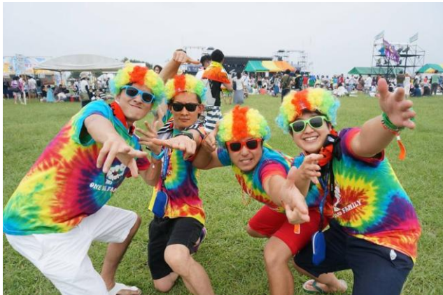
『FREEDOM』定番 カラフルなフェスファッション