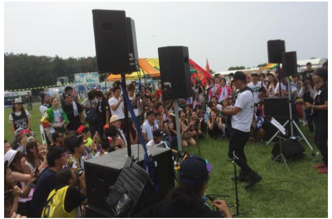
若旦那の激アツ・ウェルカムストリートライブ