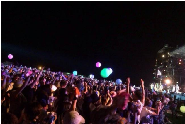
朝から夜まで盛り上げる会場