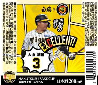
<ラベル表面 イメージ>