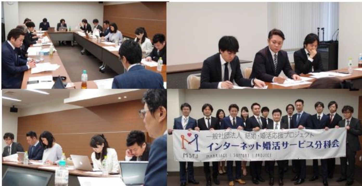
MSPJ インターネット婚活サービス分科会の様子